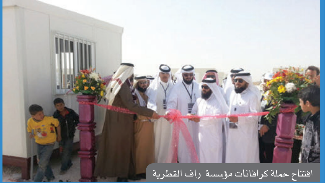
افتتاح حملة كرافانات مؤسسة راف القطرية