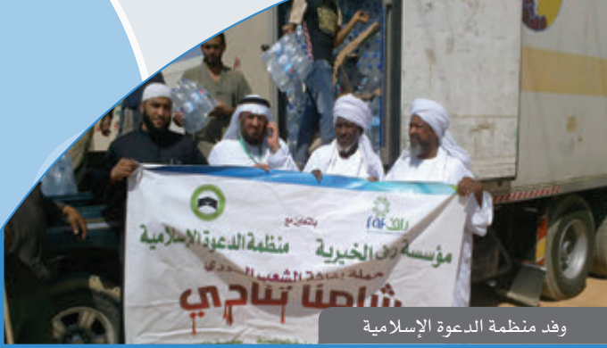
وفد منظمة الدعوة الإسلامية