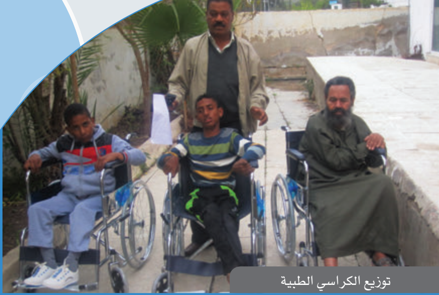
توزيع الكراسي الطبية