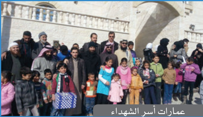
عمارات أسر الشهداء