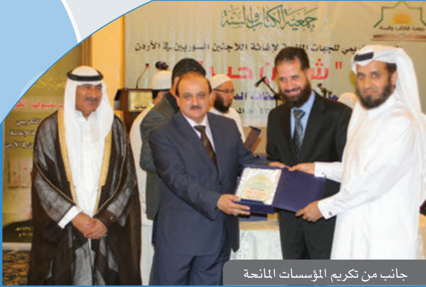
جانب من تكريم المؤسسات المانحة