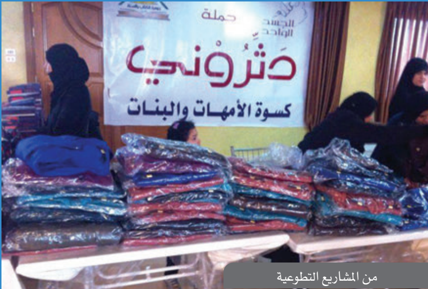
من المشاريع التطوعية