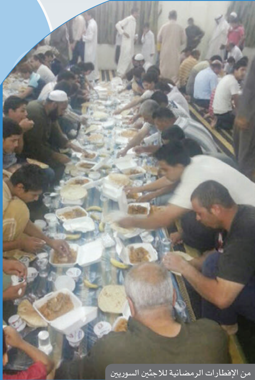
من الإفطارات الرمضانية للاجئين السوريين