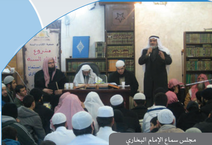
مجلس سماع الإمام البخاري