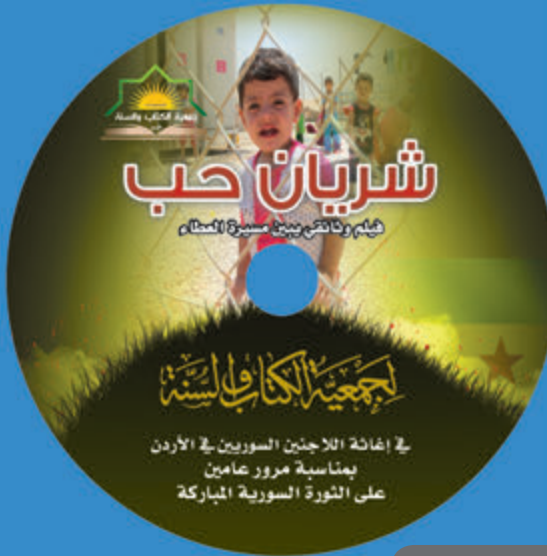
فيلم " شريان حب " الوثائقي