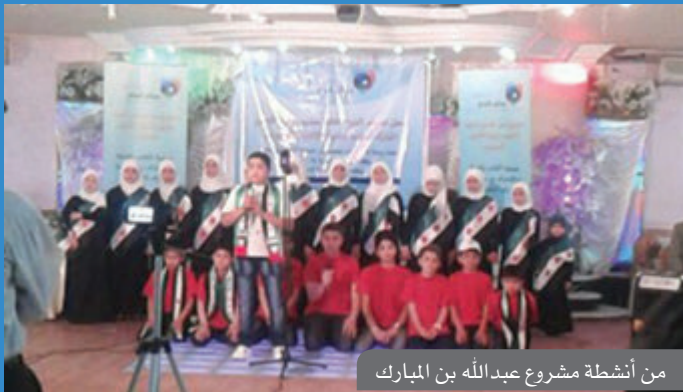
من أنشطة مشروع عبدالله بن المبارك في مخيم الزعتري