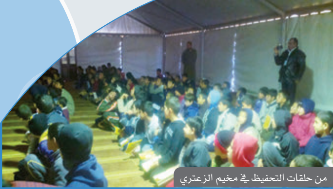
من حلقات التحفيظ في مخيم الزعتري