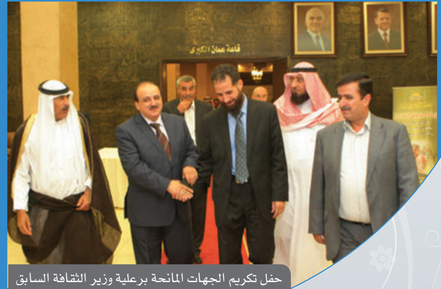
حفل تكريم الجهات المانحة برعاية وزير الثقافة السابق