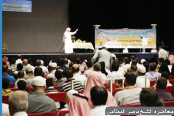
محاضرة الشيخ ناصر القطامي