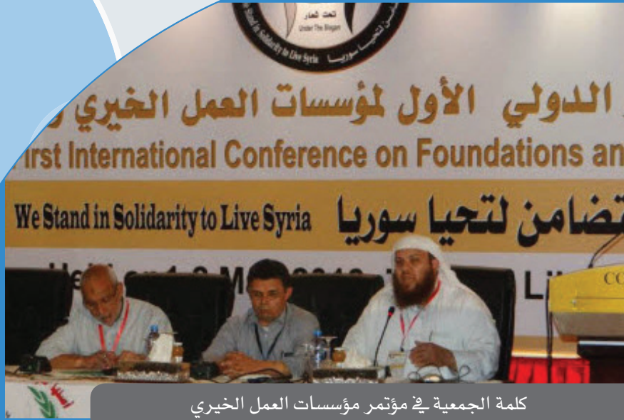
كلمة الجمعية في مؤتمر مؤسسات العمل الخيري