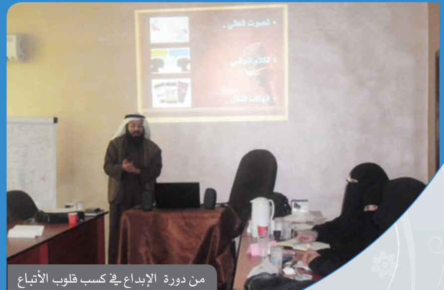
من دورة الإبداع في كسب قلوب الأتباع