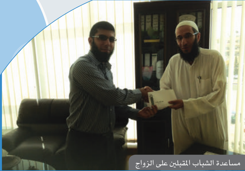
مساعدة الشباب المقبلين على الزواج