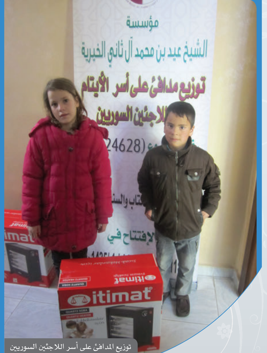
توزيع المدافئ على أسر اللاجئين السوريين