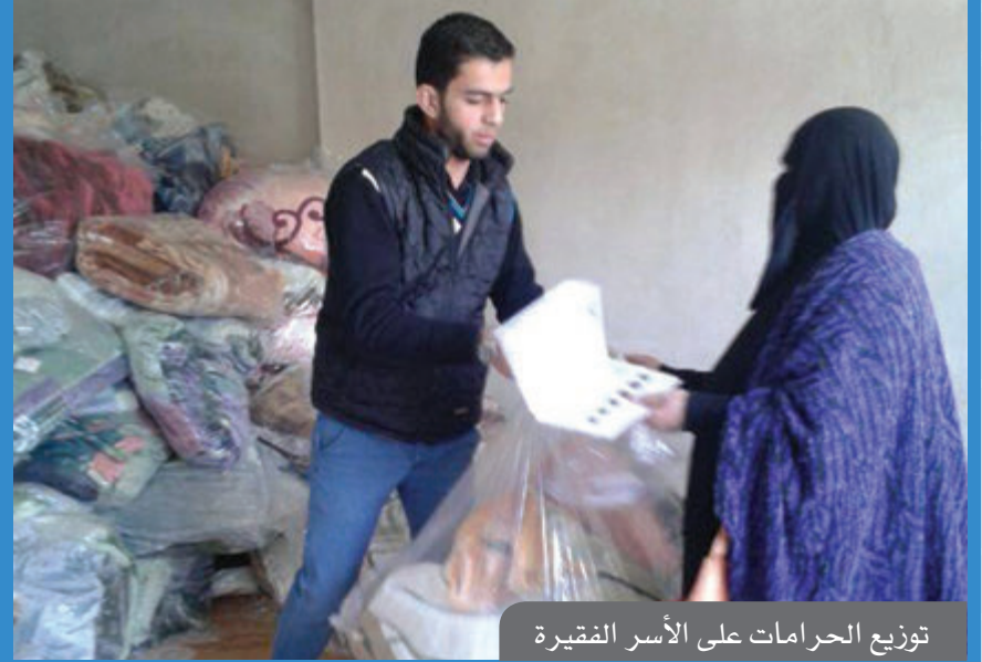
توزيع الحرامات على الأسر الفقيرة