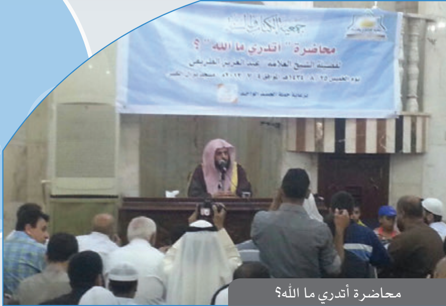
محااضرة أتدري ما الله؟