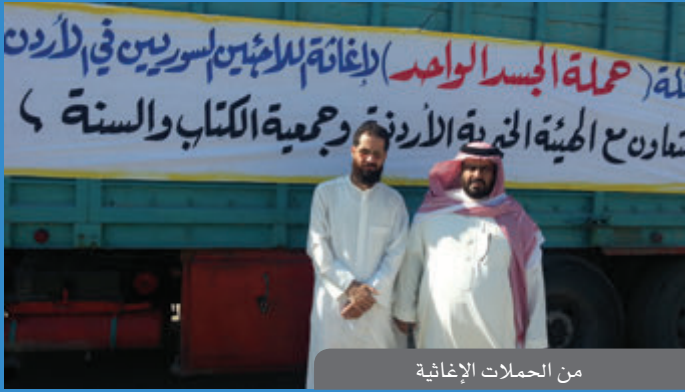
من الحملات الإغاثية