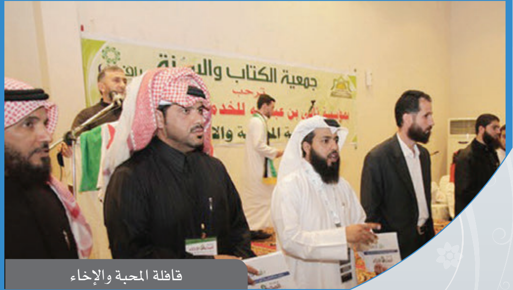
قافلة المحبة والإخاء