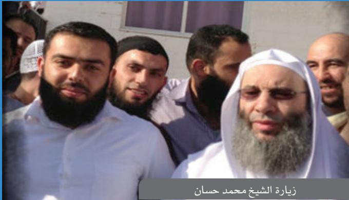
زيارة الشيخ محمد حسان