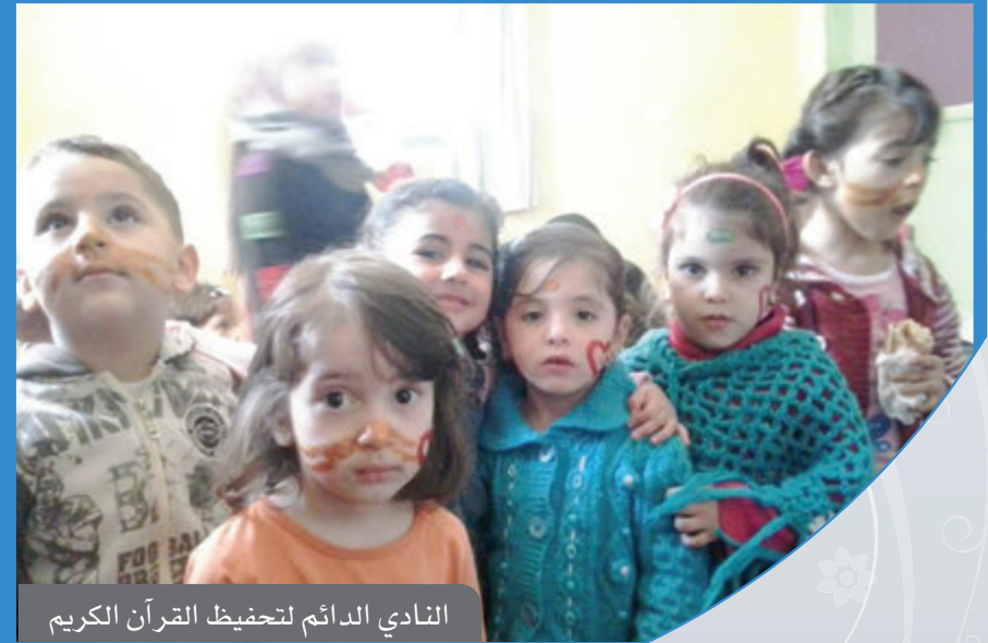
النادي الدائم لتحفيظ القرآن الكريم