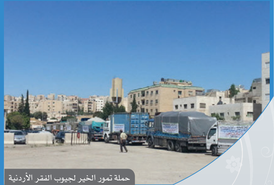
حملة تمور الخير لجيوب الفقراء الأردنية