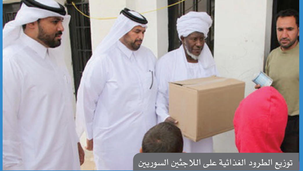
توزيع الطرود الغذائية على اللاجئين السوريين