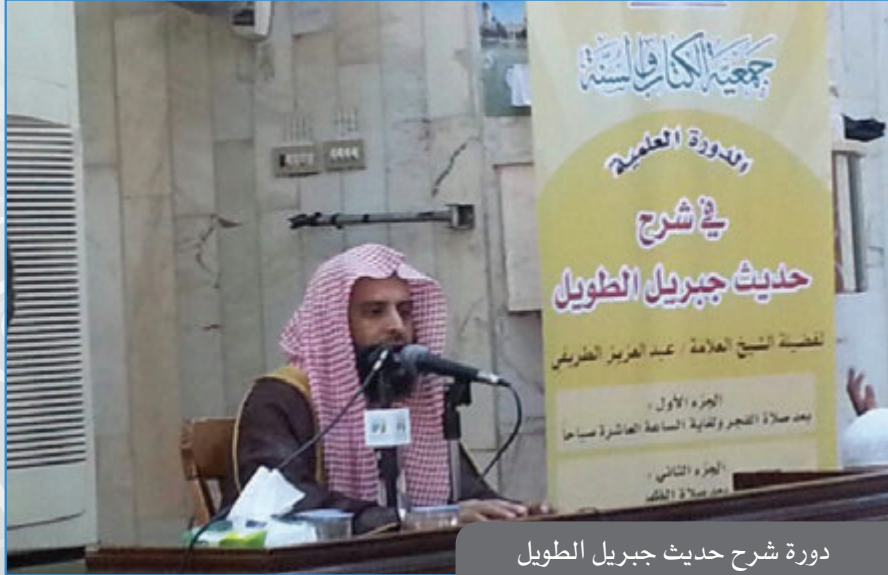
دورة شرح حديث جبريل الطويل