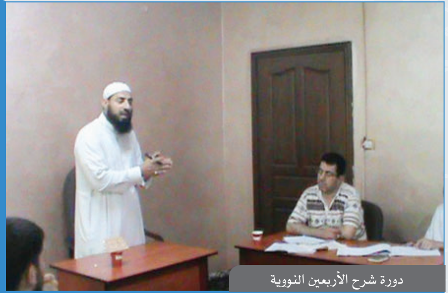
دورة شرح الأربعين النووية