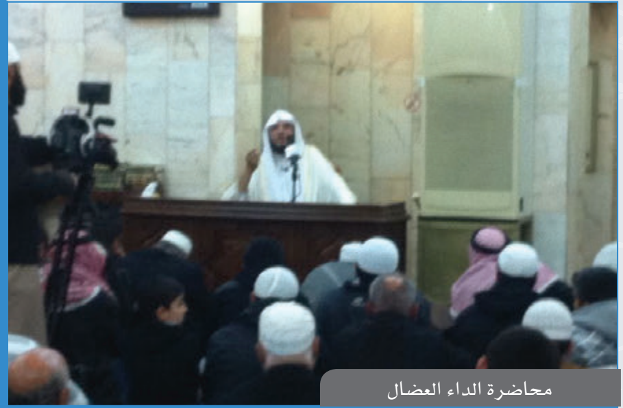
محااضرة الداء العضال