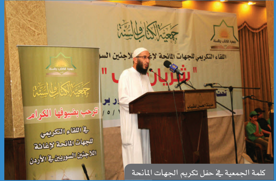
كلمة الجمعية في حفل تكريم الجهات المانحة