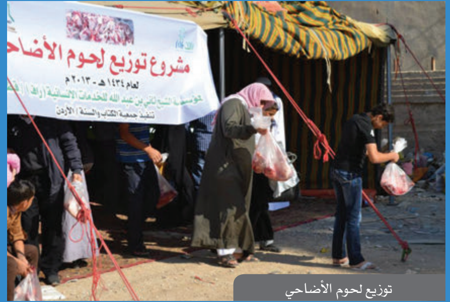
توزيع لحوم الأضاحي