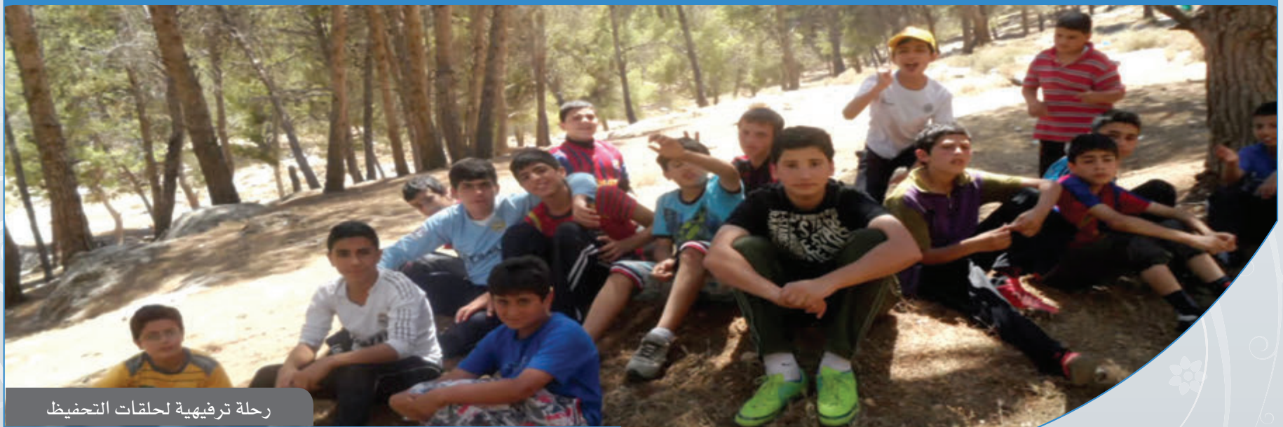
رحلة ترفيهية لحلقات التحفيظ