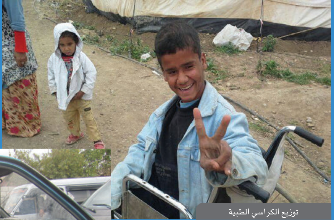
توزيع الكراسي الطبية