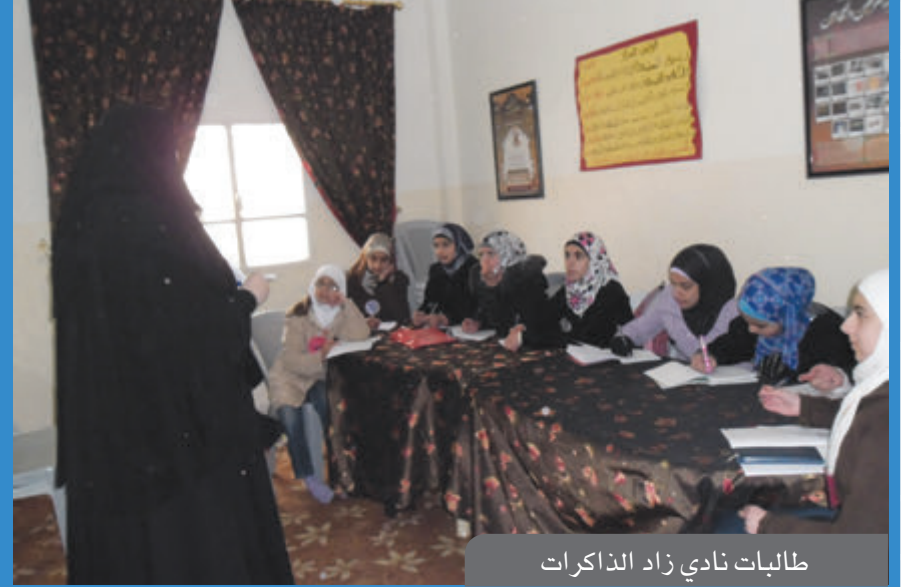
طالبات نادي زاد الذاكرات