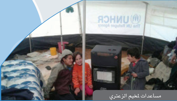
مساعدات لمخيم الزعتري