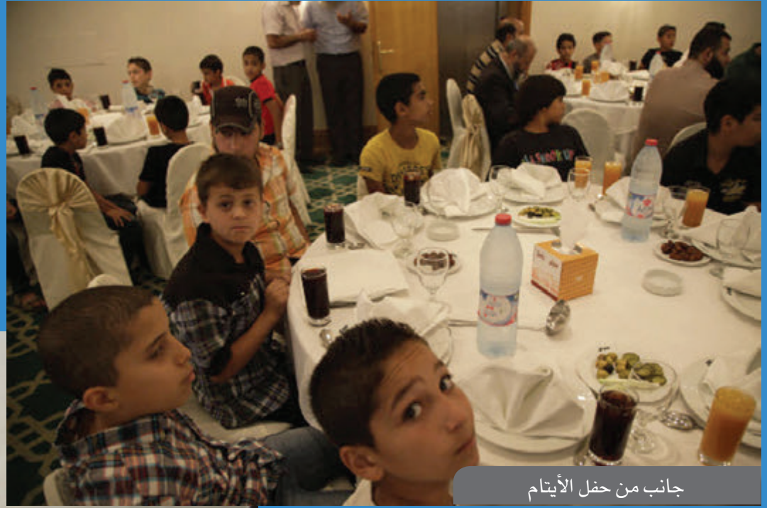
جانب من حفل الأيتام