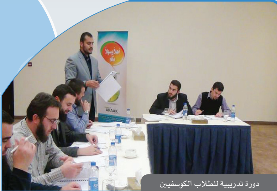
دورة تدريبية للطلاب الكوسفيين