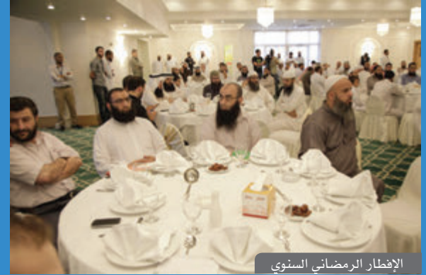
الإفطار الرمضاني السنوي