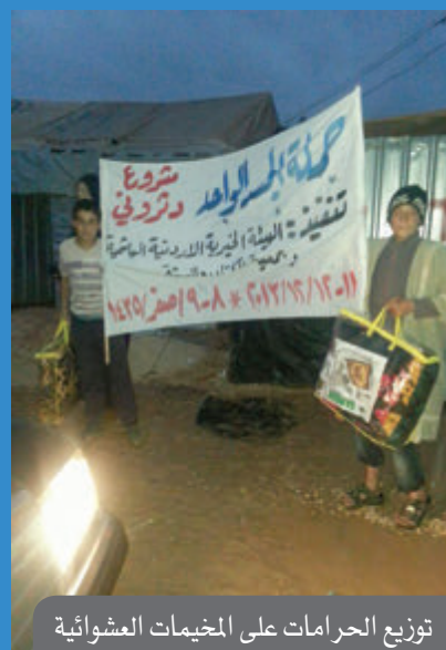
توزيع الحرمانات على المخيمات العشوائية