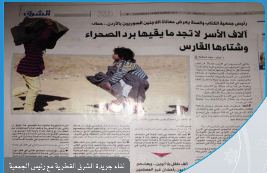
لقاء جريدة الشرق القطرية مع رئيس الجمعية