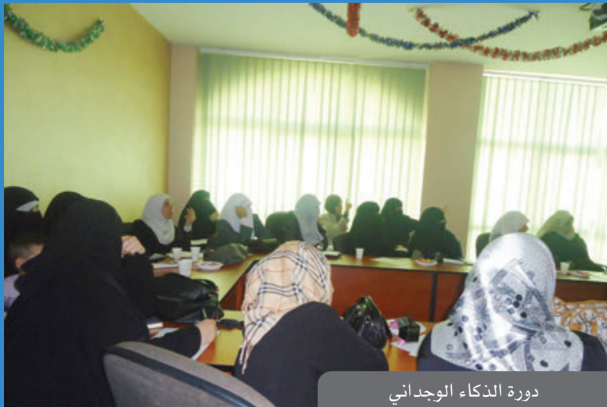
دورة الذكاء الوجداني