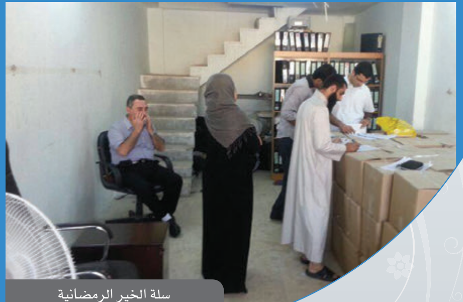
سلة الخير الرمضانية