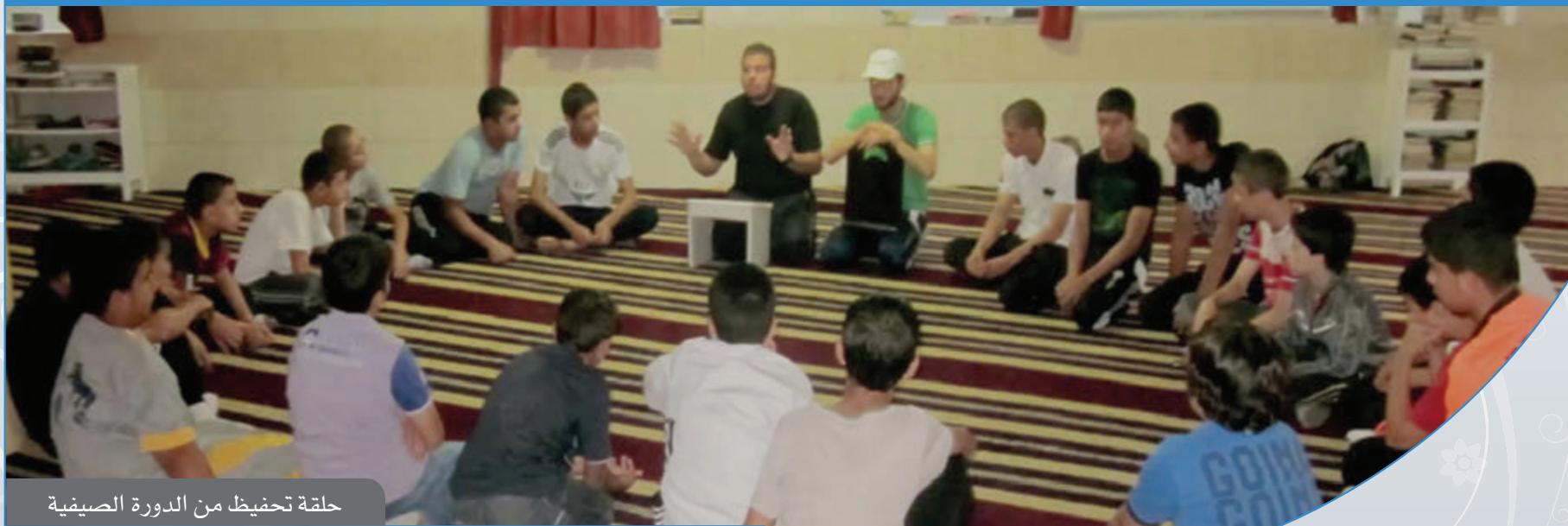
حلقة تحفيظ من الدورة الصيفية