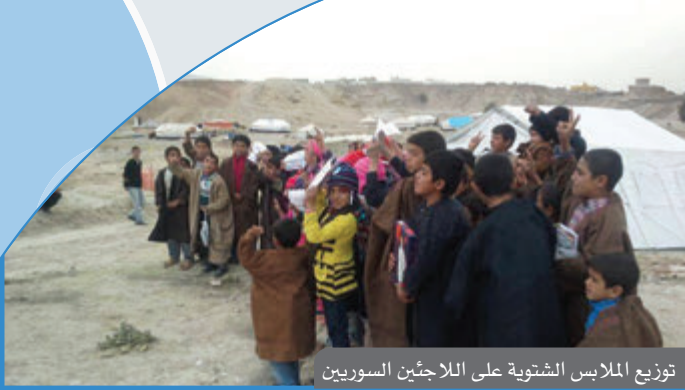
توزيع الملابس الشتوية على اللاجئين السوريين