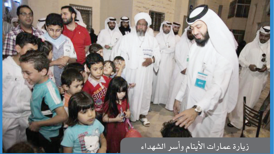
زيارة عمارات الأيتام وأسر الشهداء