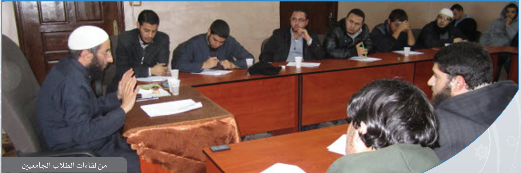
من لقاءات الطلاب الجامعيين