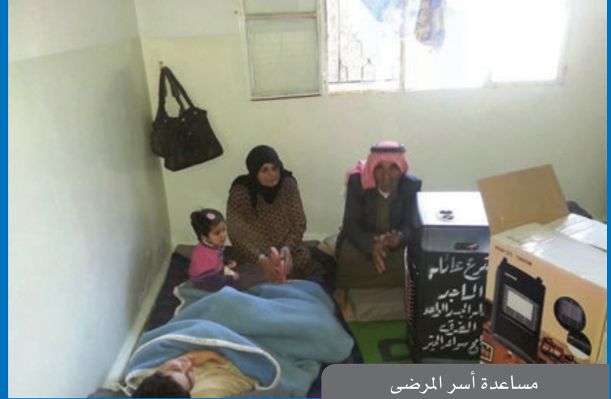
مساعدة أسر المرضى