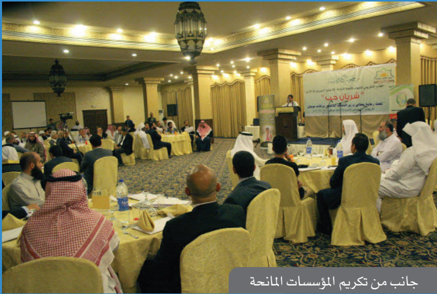
جانب من تكريم المؤسسات المانحة