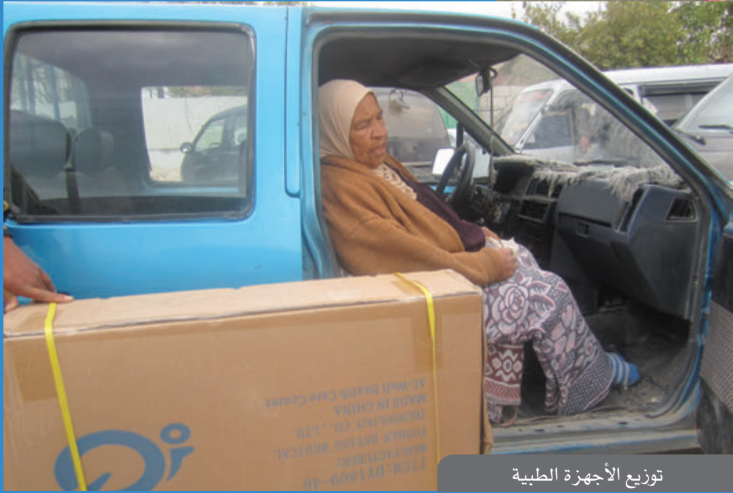
توزيع الأجهزة الطبية