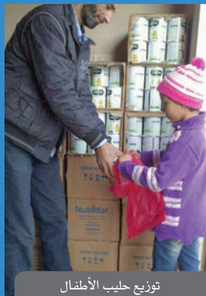
توزيع حليب الأطفال