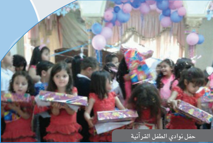
حفل نوادي الطفل القرآنية