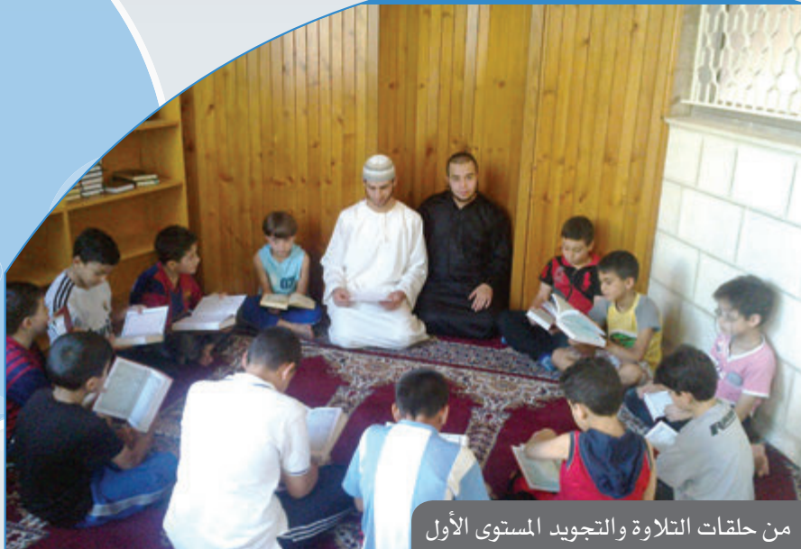
من حلقات التلاوة والتجويد المستوى الأول