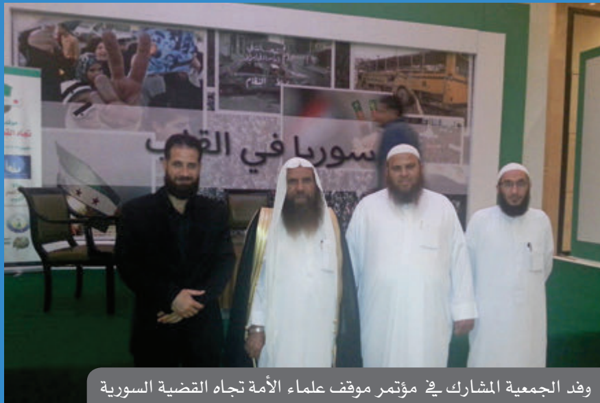
وفد الجمعية المشارك في مؤتمر موقف علماء الأمة تجاه القضية السورية