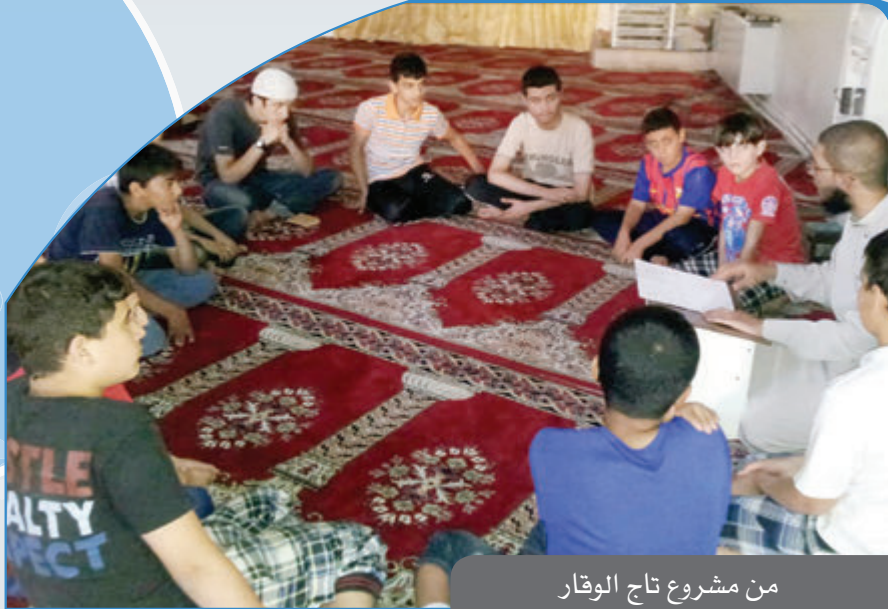
من مشروع تاج الوقار