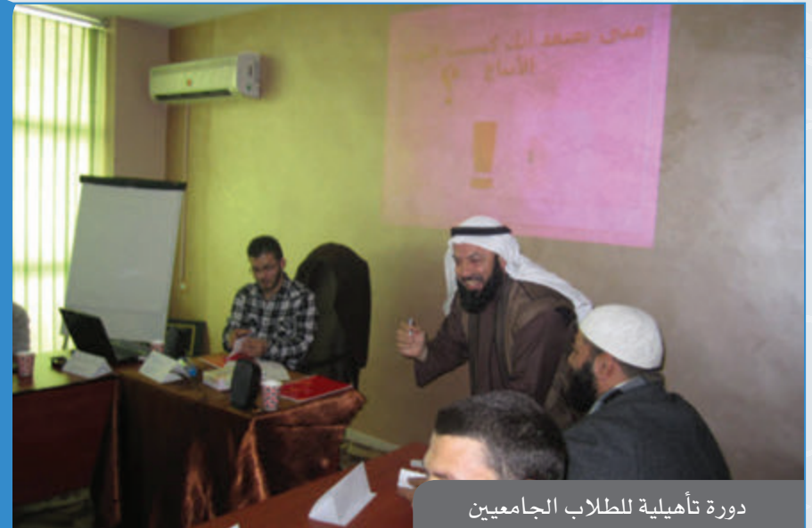
دورة تأهيلية للطلاب الجامعيين