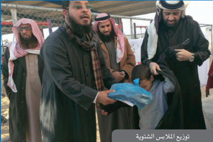
توزيع الملابس الشتوية