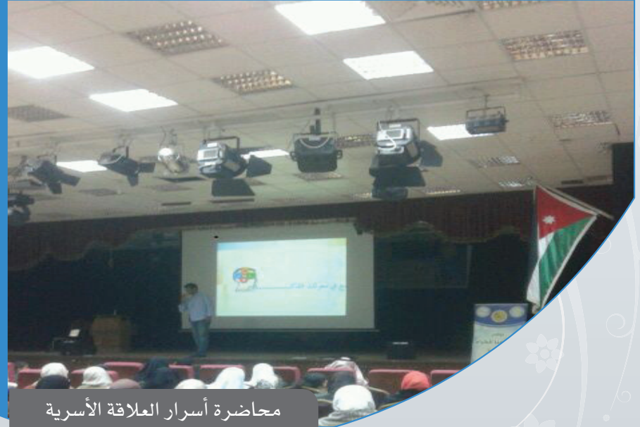
محااضرة أسرار العلاقة الأسرية