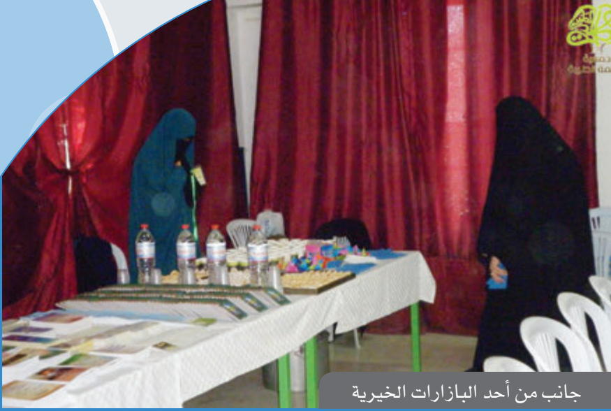
جانب من أحد البازارات الخيرية