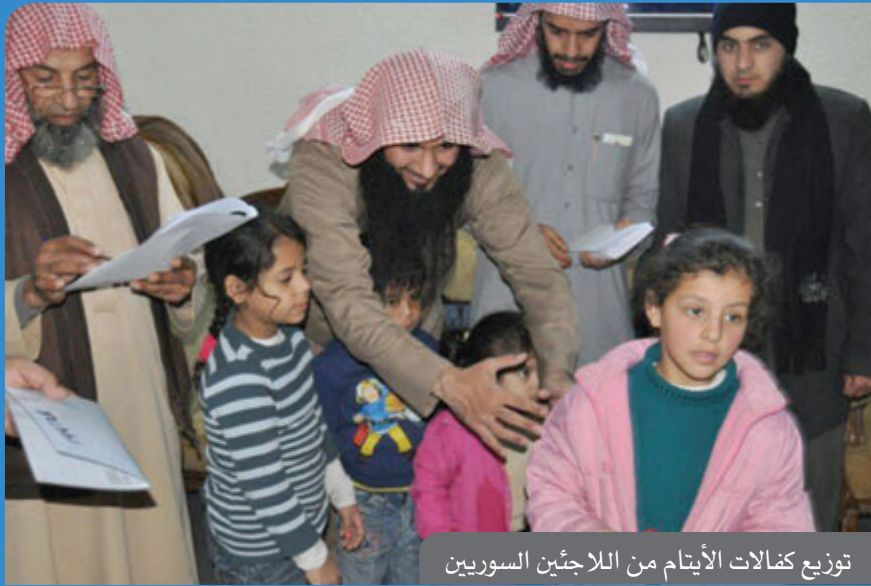
توزيع كفالات الأيتام من اللاجئين السوريين