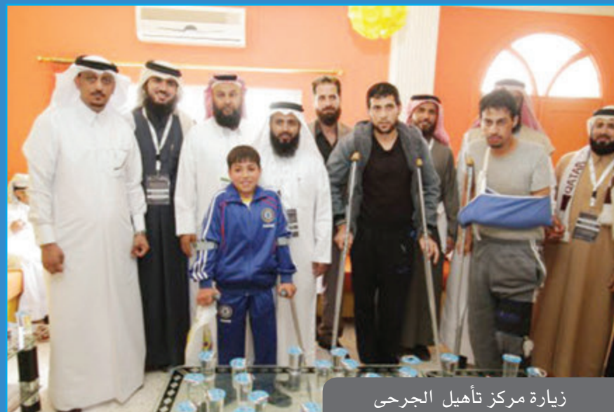
زيارة مركز تأهيل الجرحى