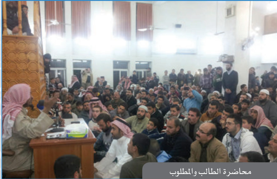
محااضرة الطالب والمطلوب