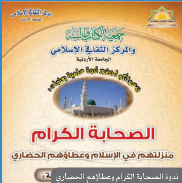
ندوة الصحابة الكرام وعطاؤهم الحضاري