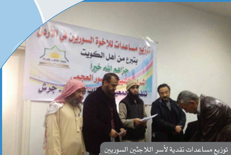
توزيع مساعدات نقدية لأسر اللاجئين السوريين