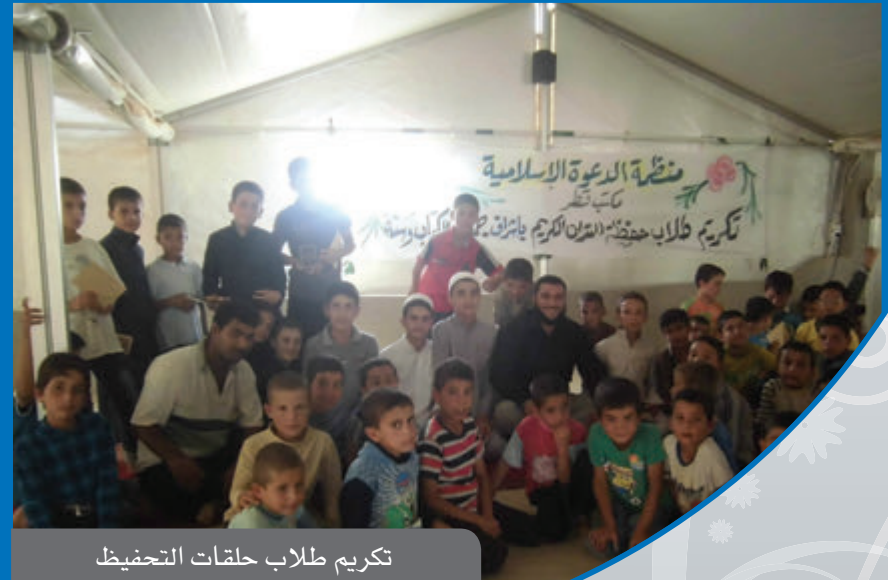
تكريم طلاب حلقات التحفيظ