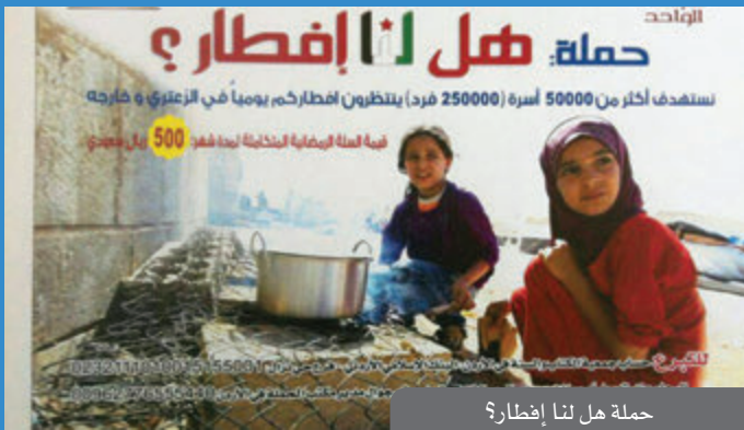
حملة هل لنا إفطار؟