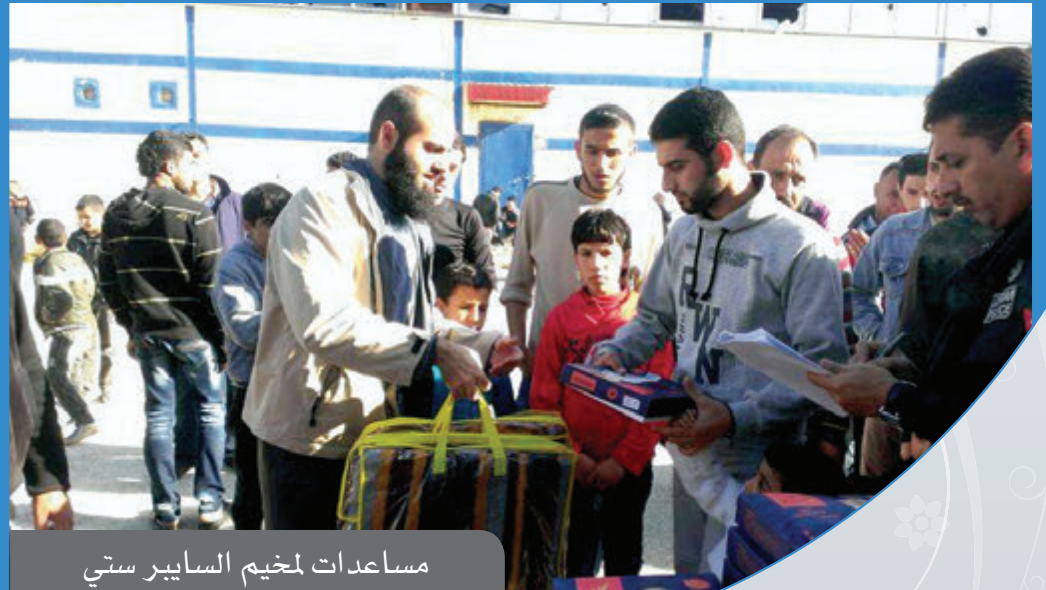
مساعدات لمخيم السايبيرستي