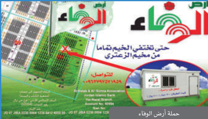
حملة أرض الوفاء