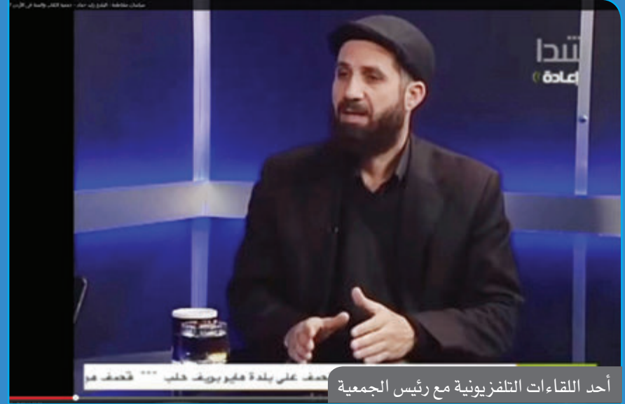
أحد اللقاءات التلفزيونية مع رئيس الجمعية