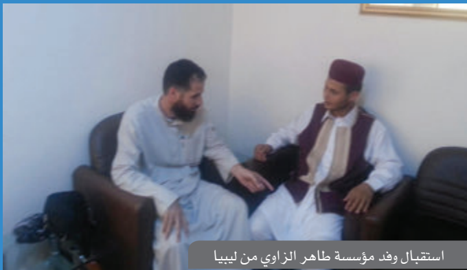
استقبال وفد مؤسسة طاهر الزاوي من ليبيا