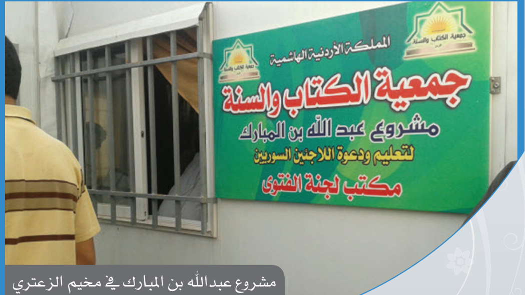
مشروع عبدالله بن المبارك في مخيم الزعتري