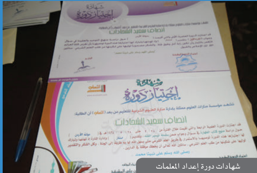
شهادات دورة إعداد المعلمات