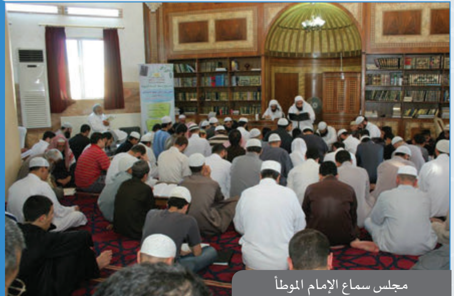
مجلس سماع الإمام الموطأ