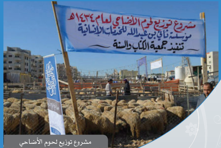
مشروع توزيع لحوم الأضاحي