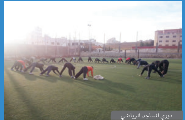
دوري المساجد الرياضي