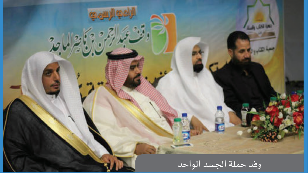
وفد حملة الجسد الواحد