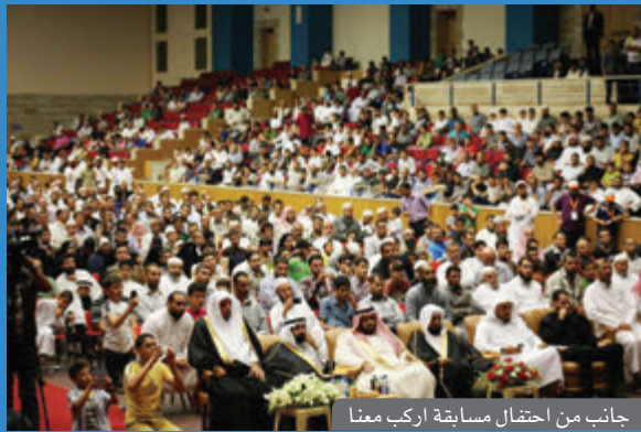
جانب من احتفال مسابقة اركب معنا