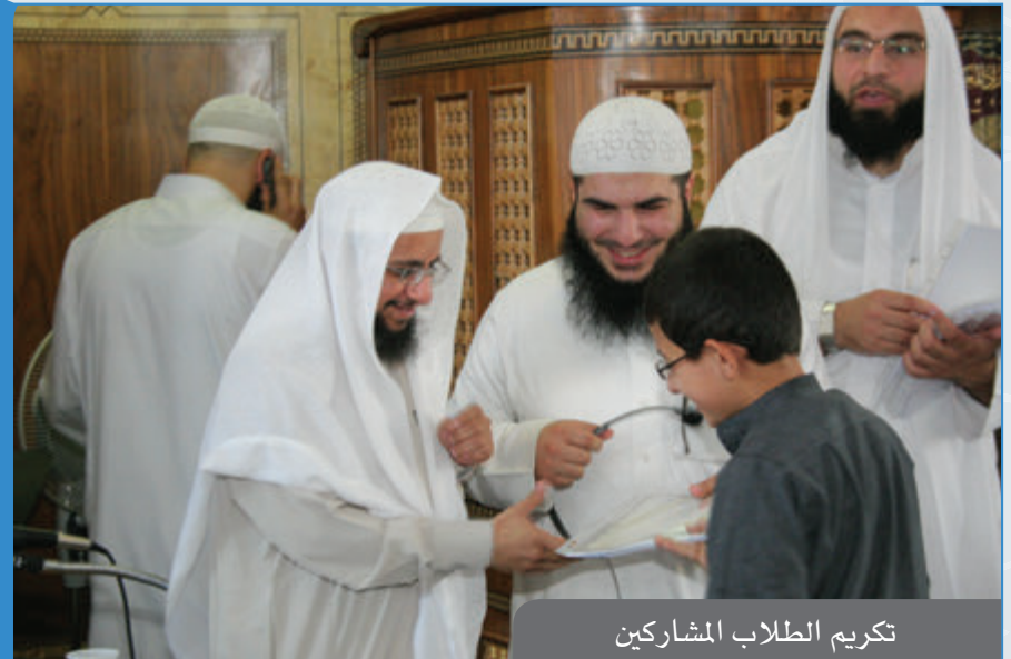
تكریم الطلاب المشاركين