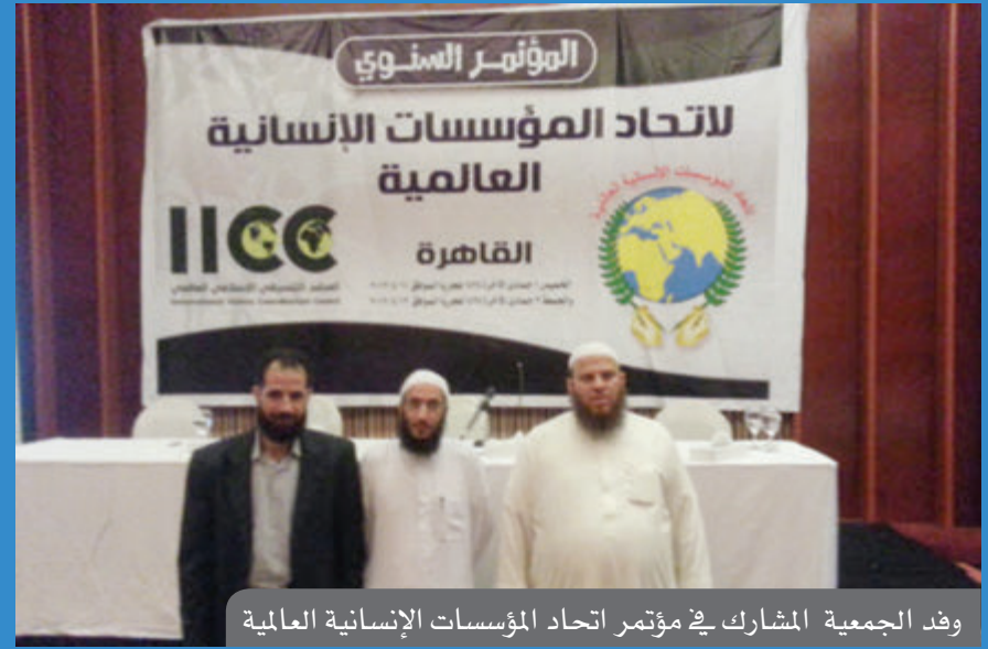
وفد الجمعية المشارك في مؤتمر اتحاد المؤسسات الإنسانية العالمية