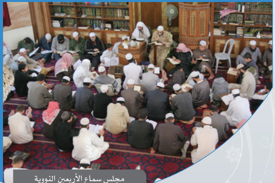
مجلس سماع الأربعين النووية