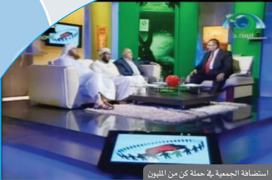
استضافة الجمعية في حملة كن من المليون