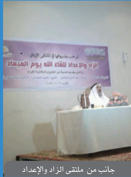
جانب من ملتقى الزاد والإعداد