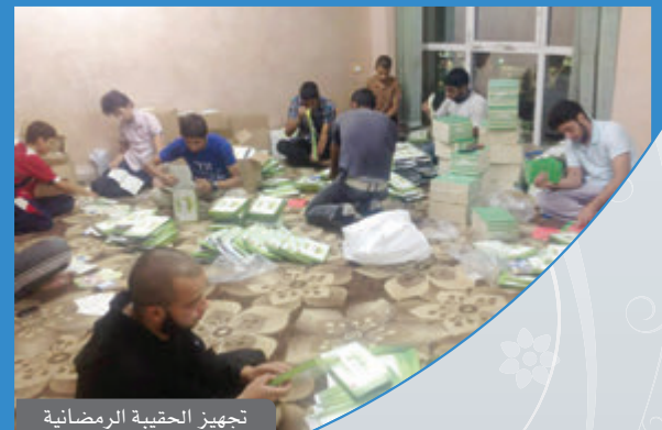
تجهيز الحقيبة الرمضانية