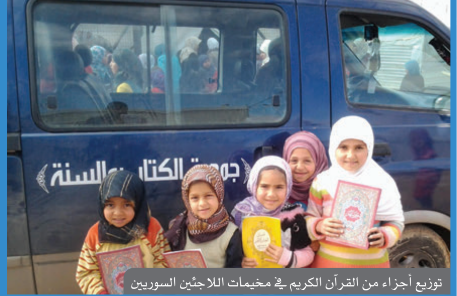
توزيع أجزاء من القرآن الكريم في مخيمات اللاجئين السوريين