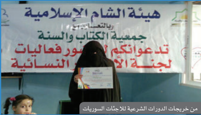
من خريجات الدورات الشرعية للاجئات السوريات