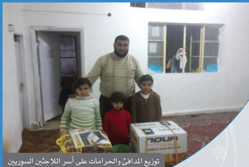
توزيع المدافئ والحرمانات على أسر اللاجئين السوريين