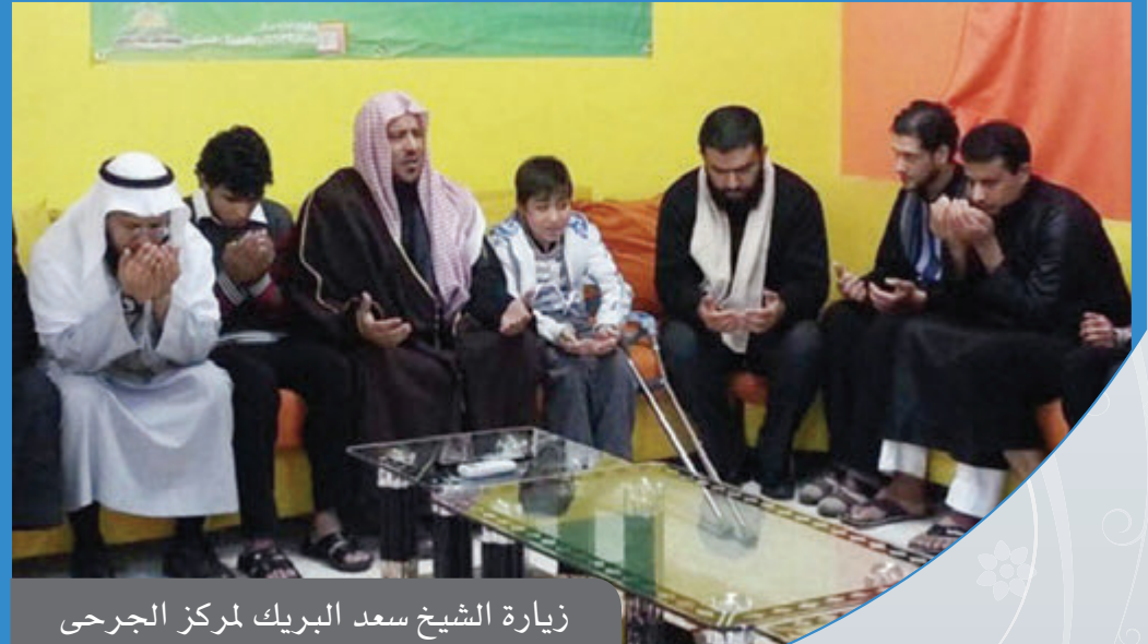
زيارة الشيخ سعد البريك لمركز الجرحى