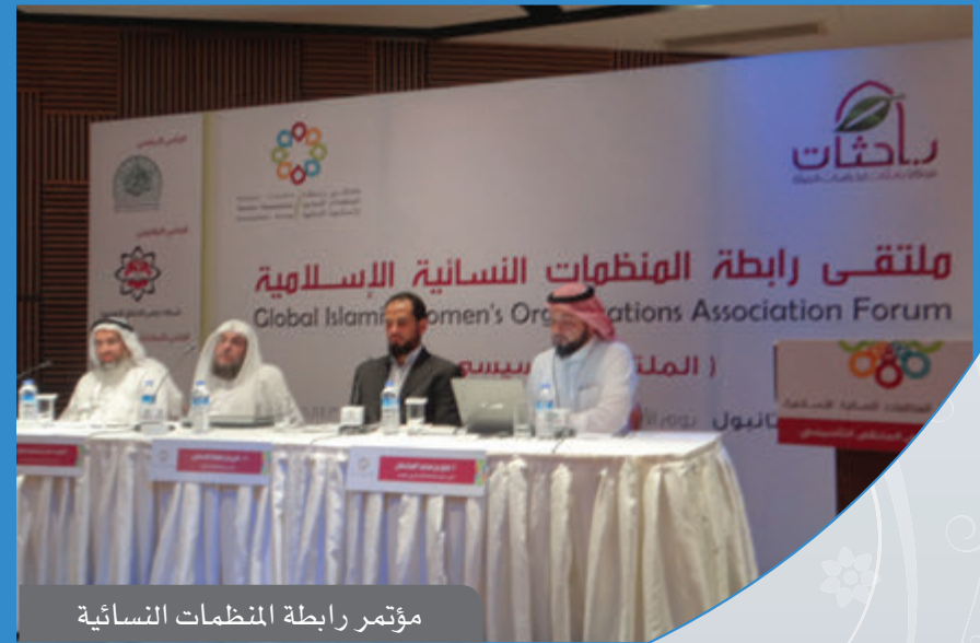
مؤتمر رابطة المنظمات النسائية